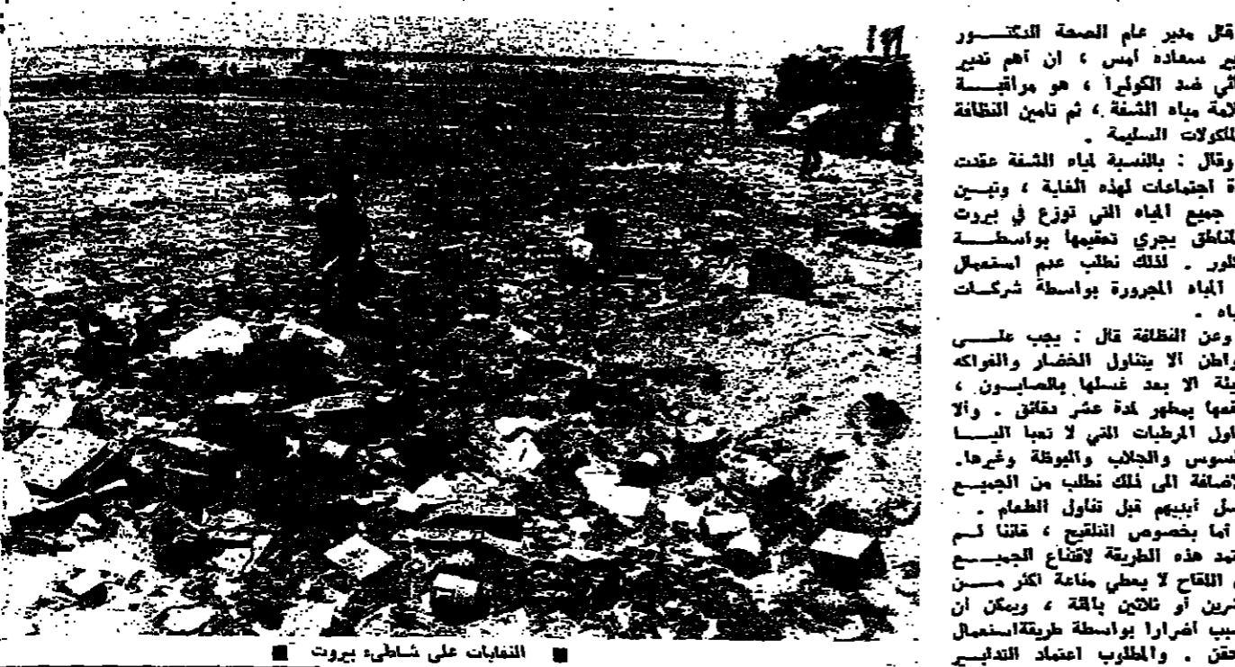
الفتيات على شاطئ بيروت